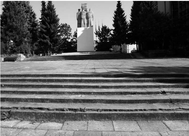
Tak wygląda dziś Plac Wolności