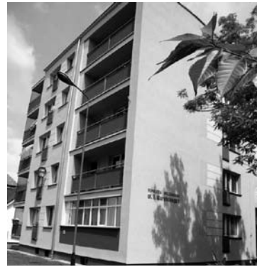
Ul. Waryńskiego 1