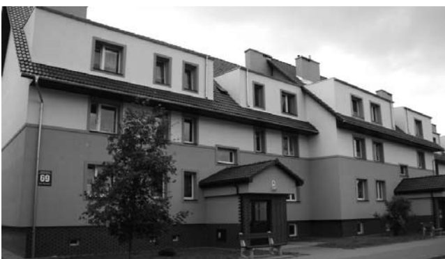
Ul. Boh. Warszawy 69