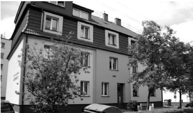
Ul. Waryńskiego 4