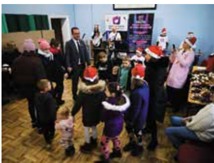
Mikołajkowa zabawa w Żabowie str. 13