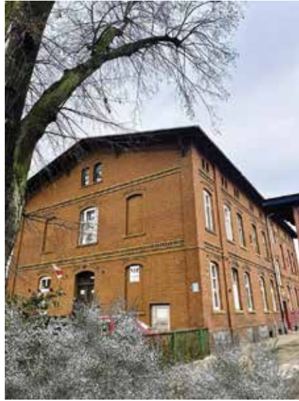
Поліклініка Praxis за адресою вул. Дворцова, 2,

W Nowogardzie mamy cztery przychodnie POZ (podstawowa opieka zdrowotna) i jeden szpital . Przychodnia Praxis pod adresem ul. Dworcowa 2, przychodnia Praxis-2 pod adresem ul. Bankowa, 3A, przy-