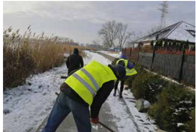
Odśnieżanie ścieżek wokół jeziora