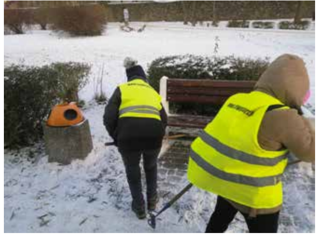
Odśnieżanie placów, chodników, schodów i przejść dla pieszych