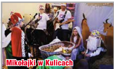
Mikołajki w Kulicach