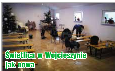
Świetlica w Wojcieszynie jak nowa