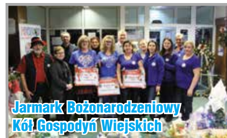
Jarmark Bożonarodzeniowy Kół Gospodyń Wiejskich