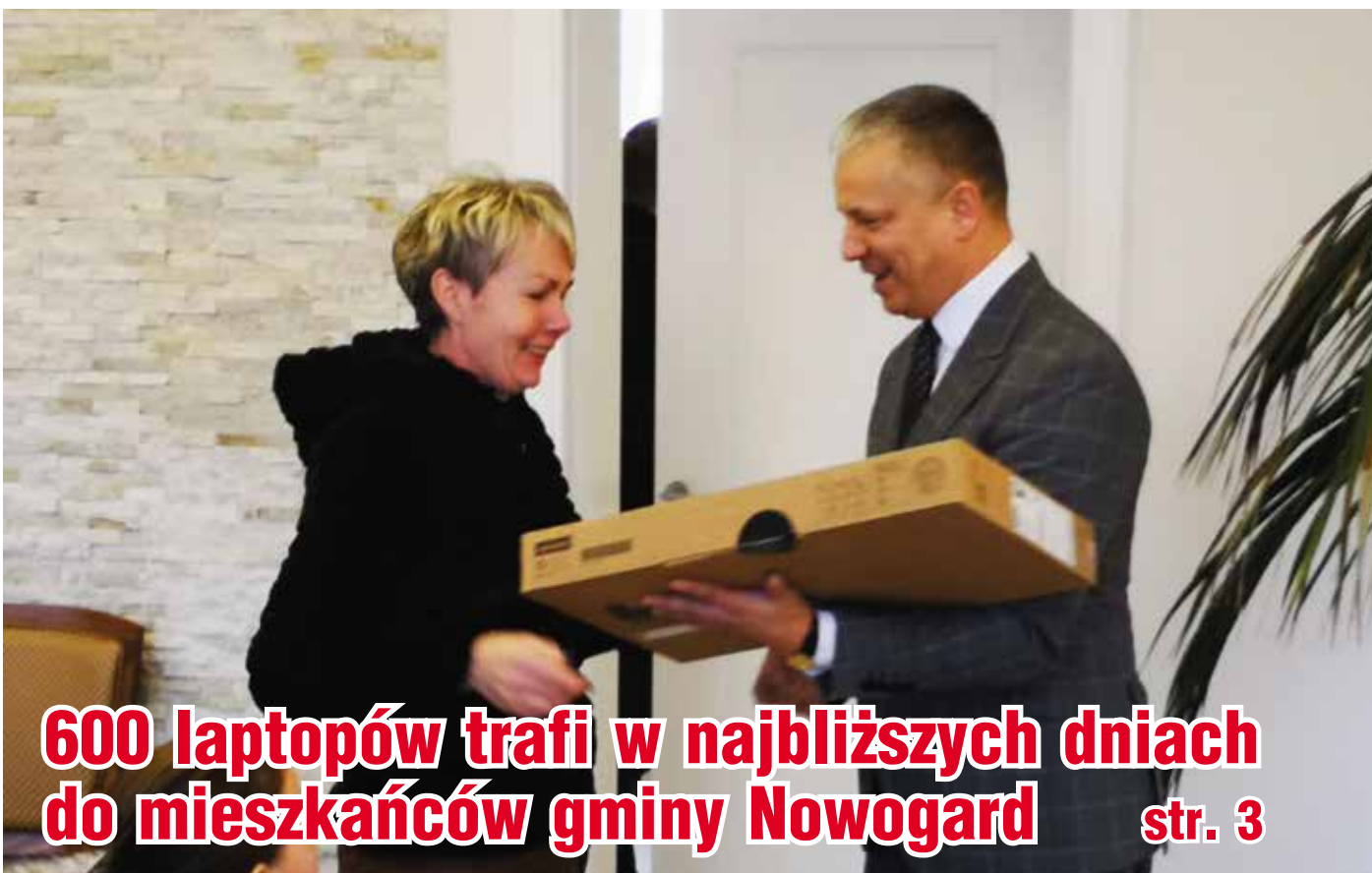
600 laptopów trafi w najbliższych dniach do mieszkańców gminy Nowogard