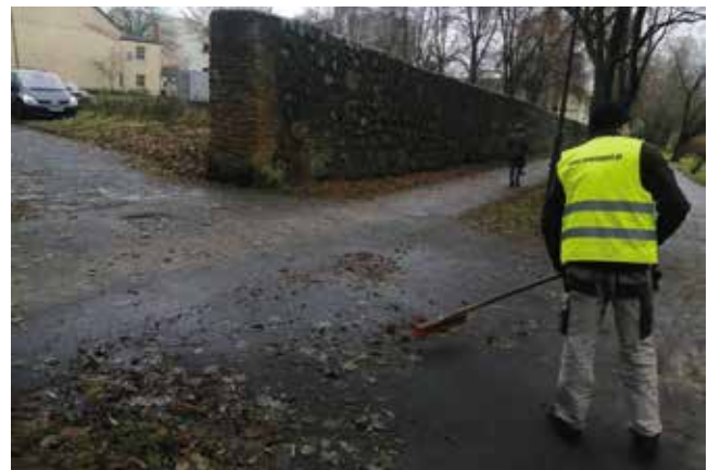
Zamiatanie ścieżek pod murami