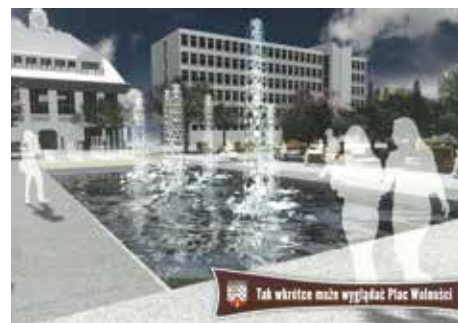
Wniosek do Budżetu Państwa na 2023 r. str. 4