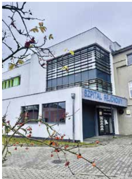
і прилікарняна поліклініка за адресою вул. Войска Польського, 7.