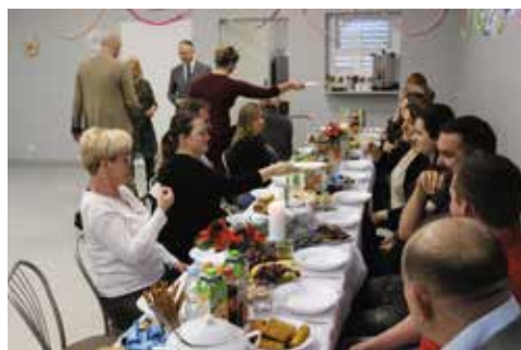
Spotkanie opłatkowe sołtysów str. 12