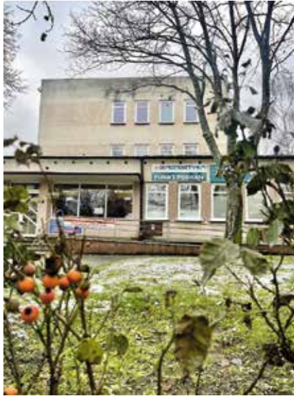
поліклініка на Костюки 36

Христина Радковська, уповноважена особа мера міста до справ польсько-українських