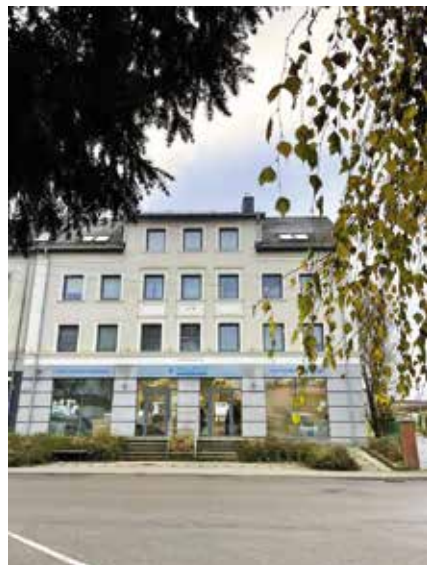
поліклініка Praxis-2 за адресою вул. Банкова, 3А,