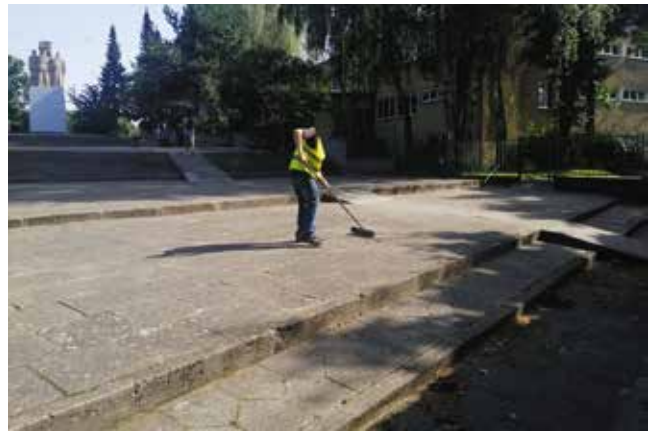
Porządki - schody za pomnikiem