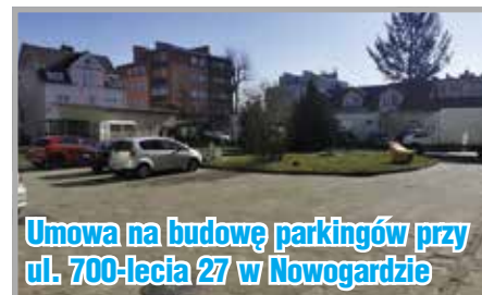
Umowa na budowę parkingów przy ul. 700-lecia 27 w Nowogardzie