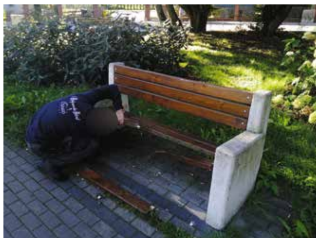
Naprawa desek na siedziiskach usytuowanych w parku przy ul. Bankowej