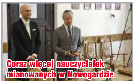
Goraz więcej nauczycielek mianowanych w Nowogardzie