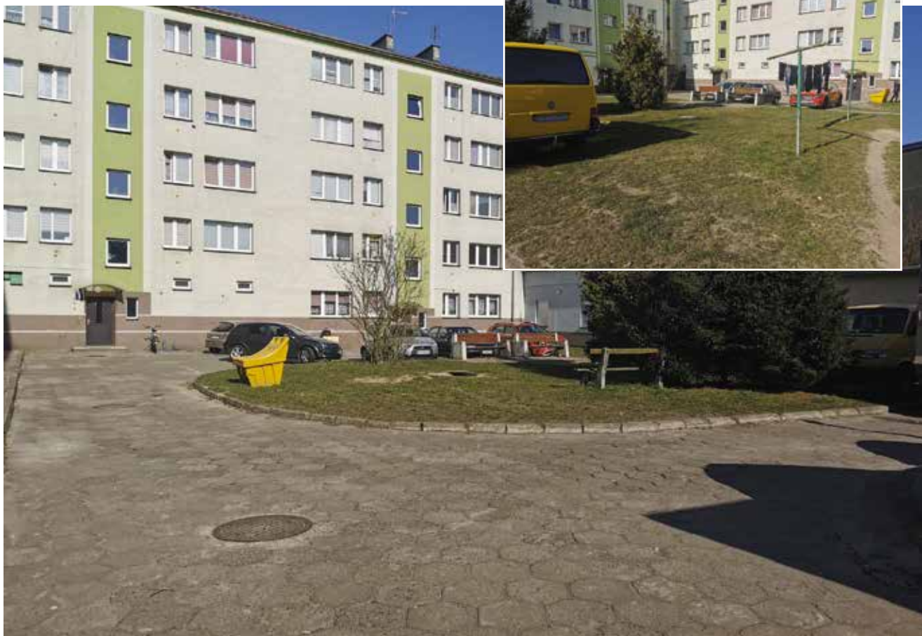
Tak dziś wygląda miejsce gdzie zostanie wykończony parking

tym: stołu betonowego wraz z 4 siedziskami, 4 koszy na odpady oraz 2 ławek parkowych, • wycinkę drzewa oraz krzewów, a w ich miejsce nasadzenie tuj, • budowę kanalizacji deszczowej Termin realizacji zamówienia to 6 miesięcy od dnia zawarcia umowy. Wykonawca na wykonane zadanie udzieli gwarancji na okres 60 miesięcy.