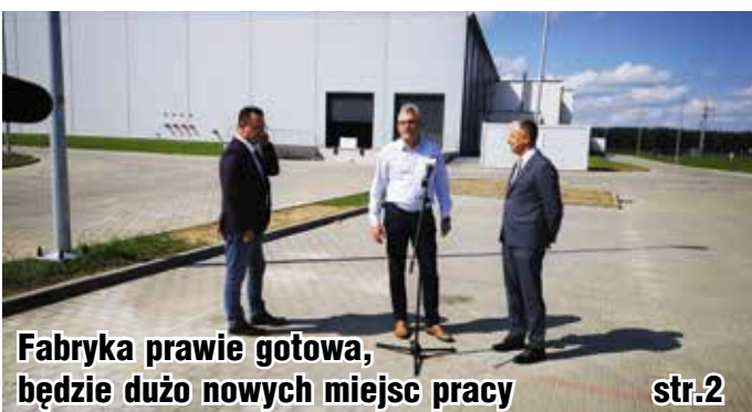
Fabryka prawie gotowa, będzie dużo nowych miejsc pracy str.2