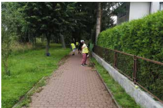
Porządkowanie chodników i krawężników przy ścieżce - ul. Promenady

również dobra współpraca burmistrza z Zakładem Karnym w Nowogardzie, dzięki któremu osoby odbywające karę pozbawienia wolności, przyczyniały się do upiększania naszego miasta poprzez pracę na rzecz jej mieszkańców. Każdego dnia te osoby pracują na naszych ulicach i wnoszą swój wkład w piękno naszego miasta i gminy.