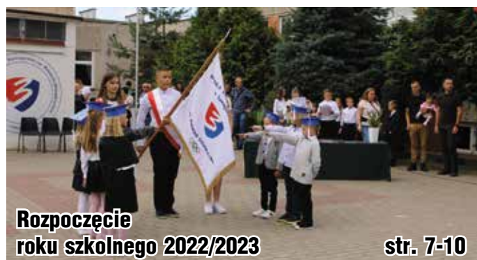
Rozpoczęcie roku szkolnego 2022/2023 str. 7-10