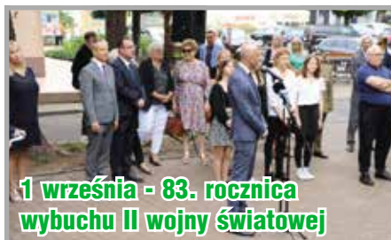
1 września - 83. rocznica wybuchu II wojny światowej