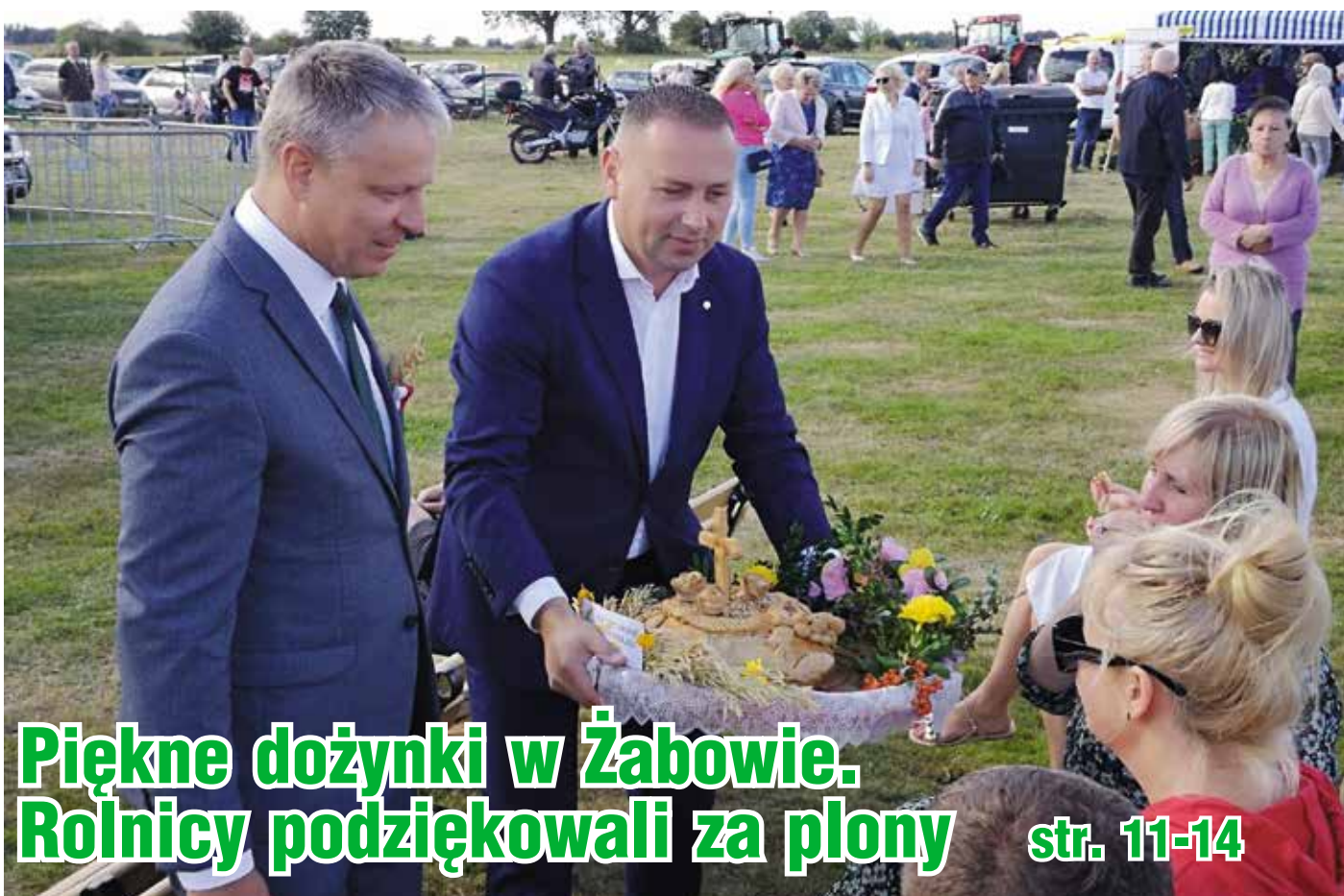
Piękne dożynki w Żabowie. Rolnicy podziękowali za plony str. 11-14