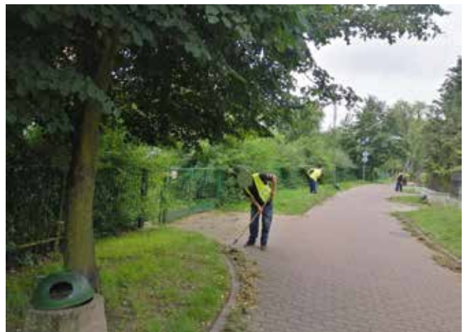
Porządki - ul. Promenada