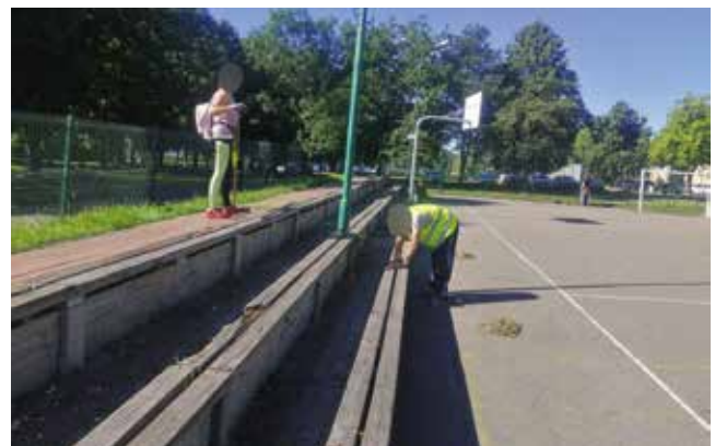
Prace porządkowe na boisku dolnym - pl. Szarych Szeregów