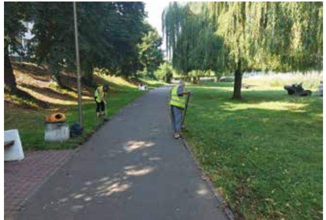
Prace porządkowe, hakanie obrzeży krawężnika, ścieżki pieszo-rowerowej wzdłuż ul. Zielonej