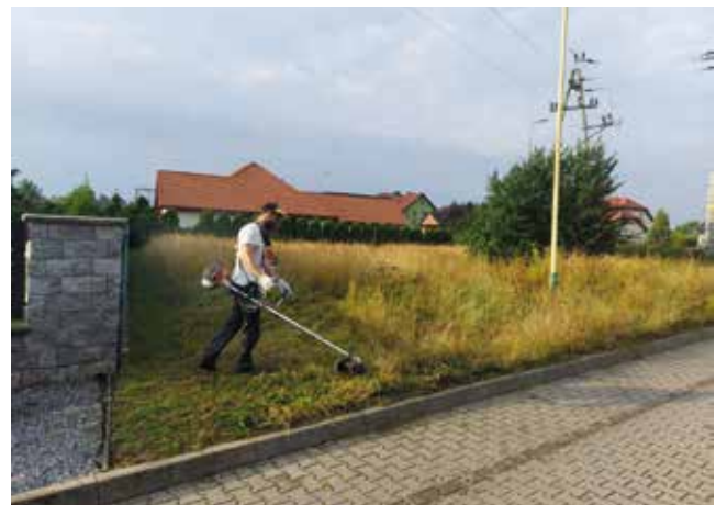
Koszenie pobocza drogi - ul. Ogrodowa