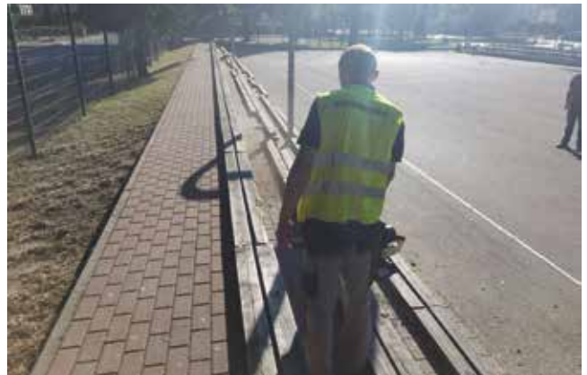
Sprzątanie - boisko dolne