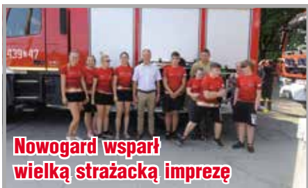
Nowogard wsparł wielką strażacką imprezę