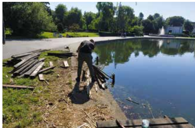
Naprawa kładki na murku przy jeziorze