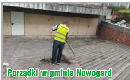
Porządki w gminie Nowogard