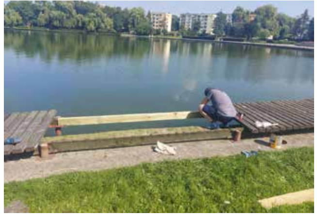
Naprawa kładki drewnianej wzdłuż murka jeziora