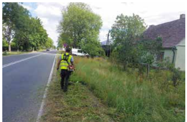
Koszenie poboczy wzdłuż drogi Nowogard - Olchowo