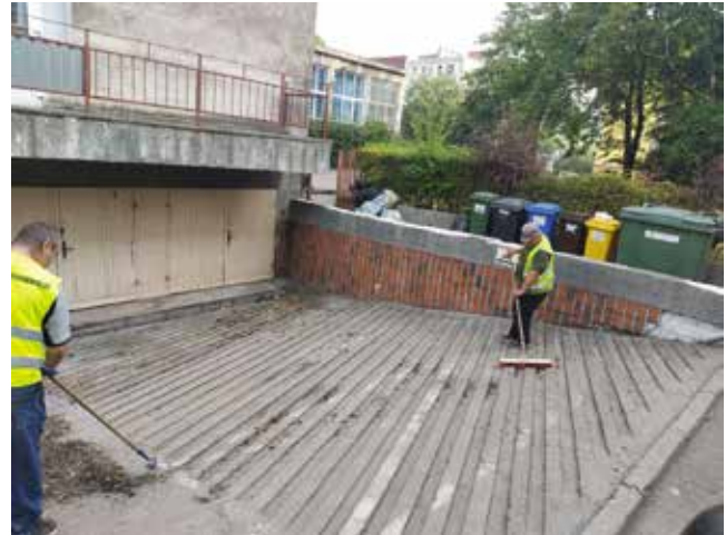
Hakanie i sprzątanie wjazdów do garaży - Plac Wolności 5