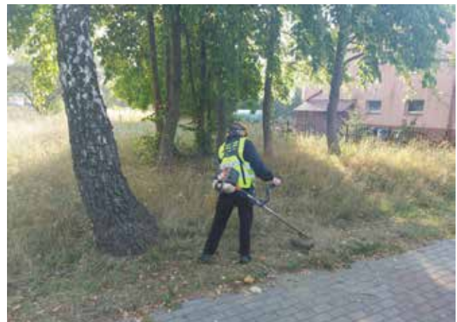
Koszenie terenów zielonych i trawników wzdłuż chodnika - ul. G. Bema