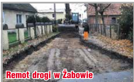
Remont drogi w Żabowie