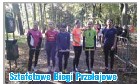
Sztafetowe Biegi Przelajowe