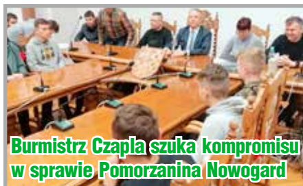
Burmistrz Czapla szuka kompromisu w sprawie Pomorzana Nowogard