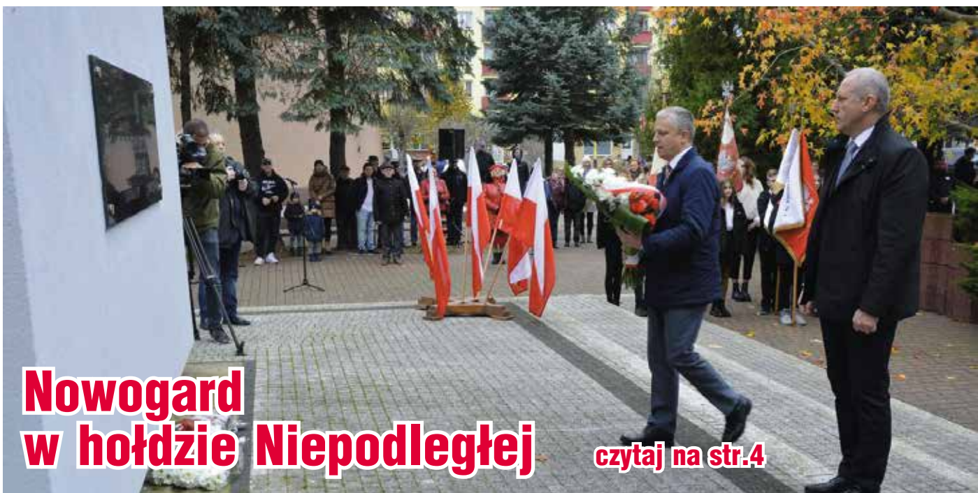
Nowogard w hołdzie Niepodległej