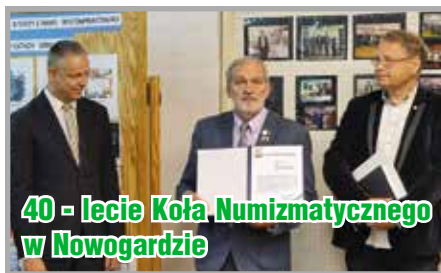
40 - lecie Koła Numizmatycznego w Nowogardzie