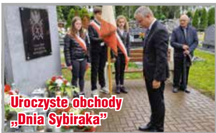
Uroczyste obchody „Dnia Sybiraka”