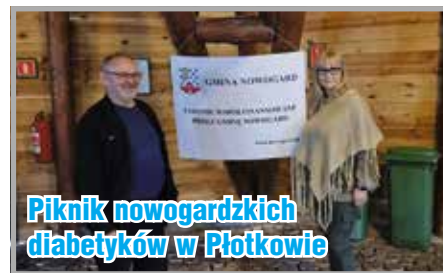
Piknik nowogardzkich diabetyków w Płotkowie