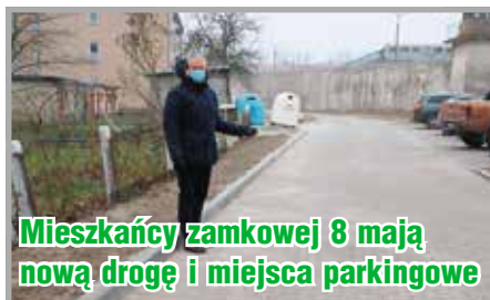
Mieszkańcy zamkowej 8 maja nową drogę i miejsca parkingowe