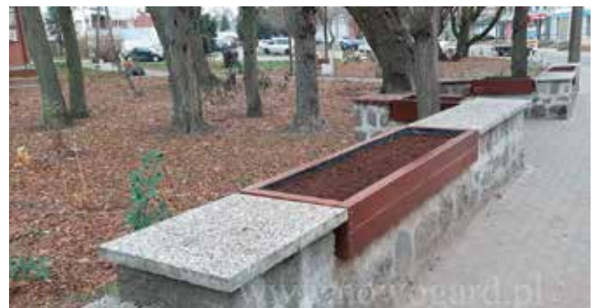
Tak było wcześniej