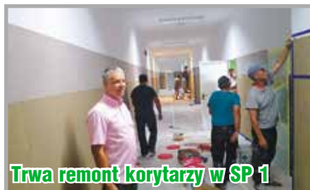
Trwa remont korytarzy w SP 1