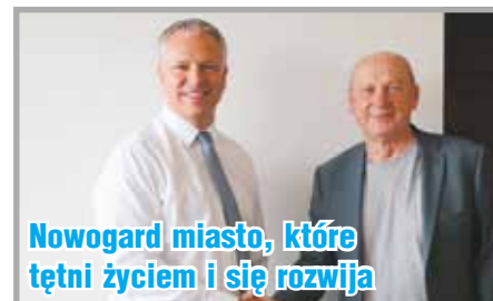
Nowogard miasto, które tętni życiem i się rozwija