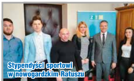
Stypendyści sportowi w nowogardzkim Ratuszu