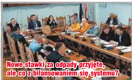
Nowe stawki za odpady, przyjęte, ale co z bilansowaniem się systemu?