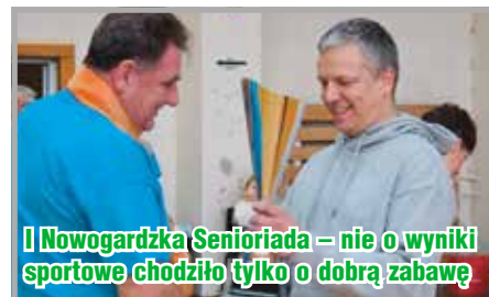
I Nowogardzka Senioriada – nie o wyniki sportowe chodziło tylko o dobrą zabawę