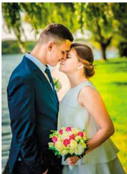
Zwycięska fotografia w Konkursie Walentynkowym pn. „W Nowogardzie Miłość jest na każdym rogu”.