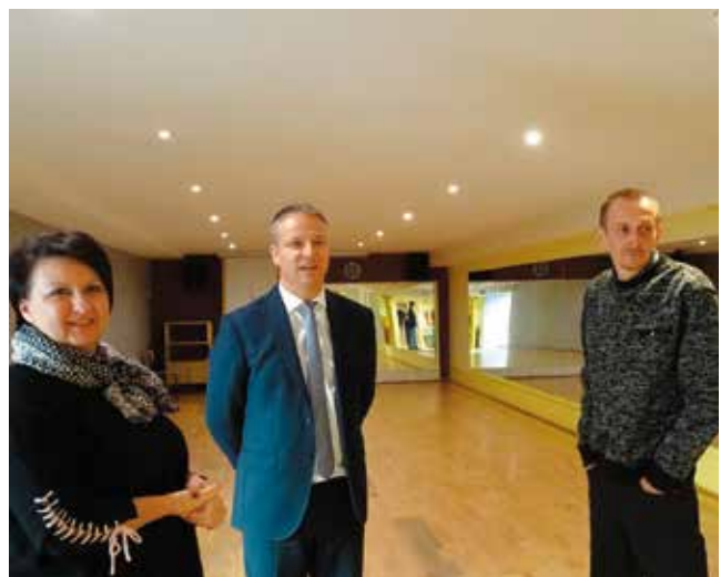
Z wizytą w NDK