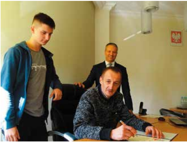
„Nowy” burmistrz przy pracy