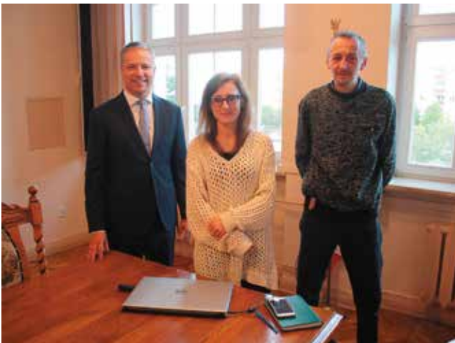
Burmistrzowie z radcą prawnym