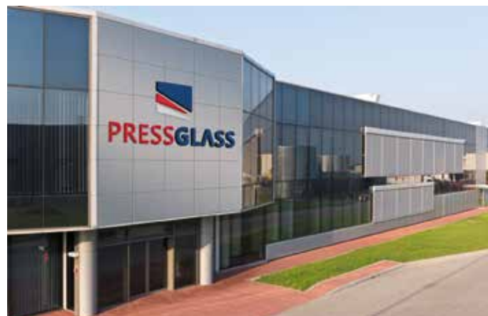
Siedziba firmy Press Glass w Radomsku

Nowogardzką strefę ekonomiczną, w ramach Kostrzyńsko-Słubickiej Specjalnej Strefy Ekonomicznej, utworzyliśmy w roku 2013. Wtedy, było to pole. Dziś, dzięki m.in. pozyskanym środkom unijnym mamy ten teren uzbrojony w drogę oraz w kanalizację deszczową, ściekową oraz w sieć