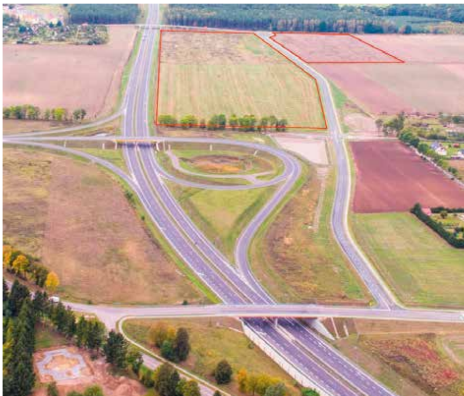
Strefa z lotu ptaka

Już w kilka tygodni po oficjalnym ustanowieniu podstrefy, rozpocząłem rozmowy z operatorami mediów: ENEA i PGNiG i otrzymałem od nich zapewnienie, że każdy inwestor może liczyć na podłączenie gazu zgodnie z własnym zapotrzebowaniem.