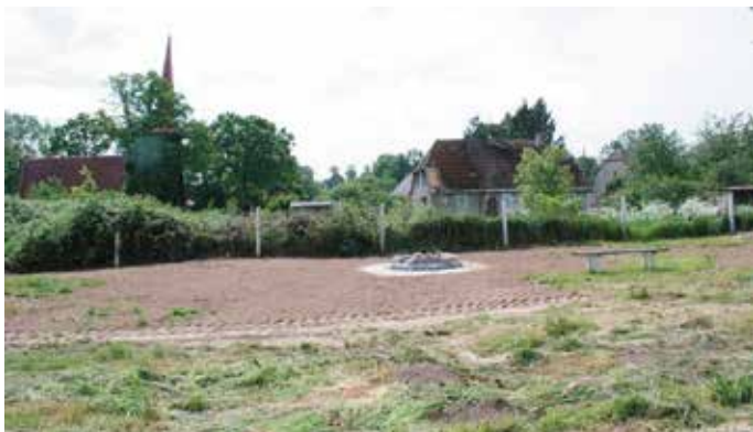
Tu będzie świetlica w Wyszomierzu